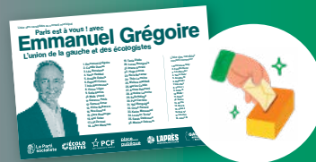
Emmanuel Grégoire pour Paris (enveloppe jaune)