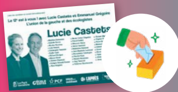
Lucie Castets pour le 12 e (enveloppe bleue)

Pour chaque tour, deux urnes, deux bulletins, on vote :